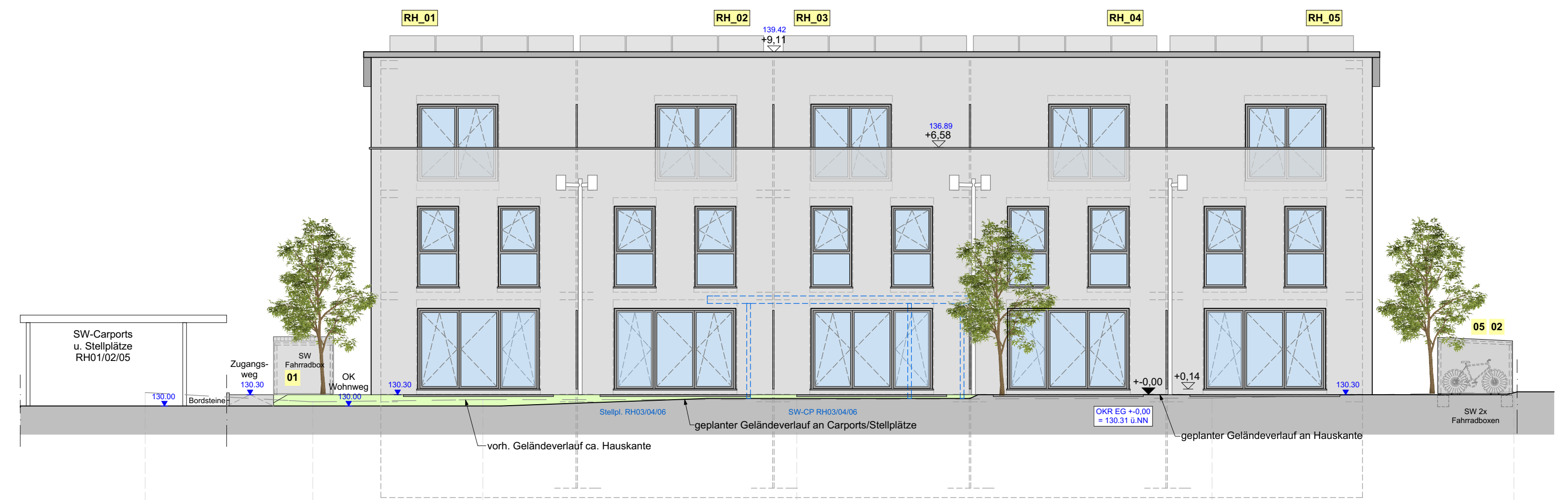
Ansicht von Süden